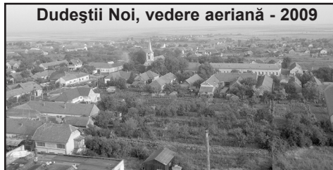
Dudeștii Noi, vedere aeriană - 2009

pece-negilor, un popor seminomad originar din stepele Asiei Centrale și care vorbea o limbă turcă.